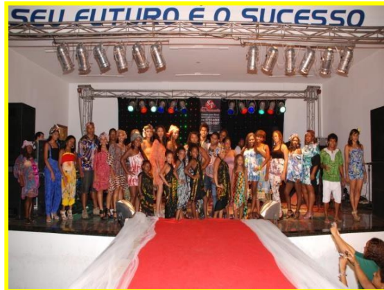
Desfile da Beleza Negra Adulto e Mirim