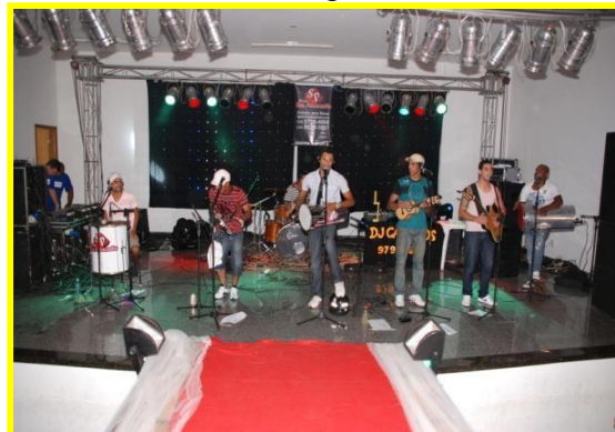
Grupo de Samba Sem preconceito