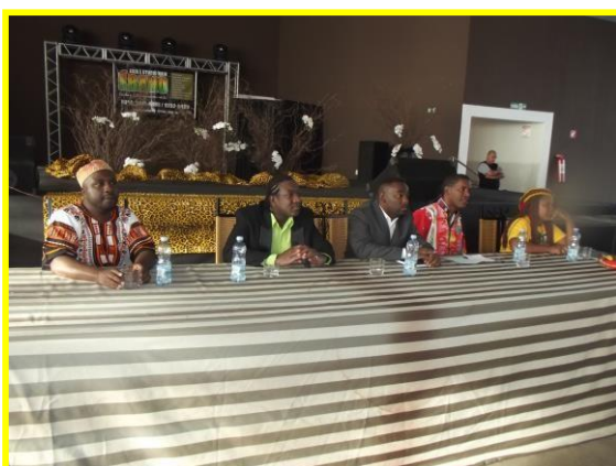
Mesa de Debates