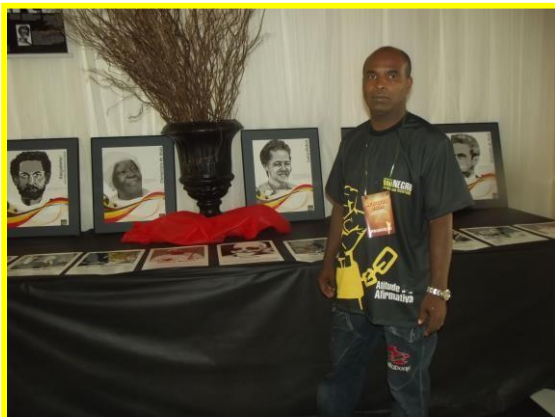
Exposição de Líderes Negros Brasileiros