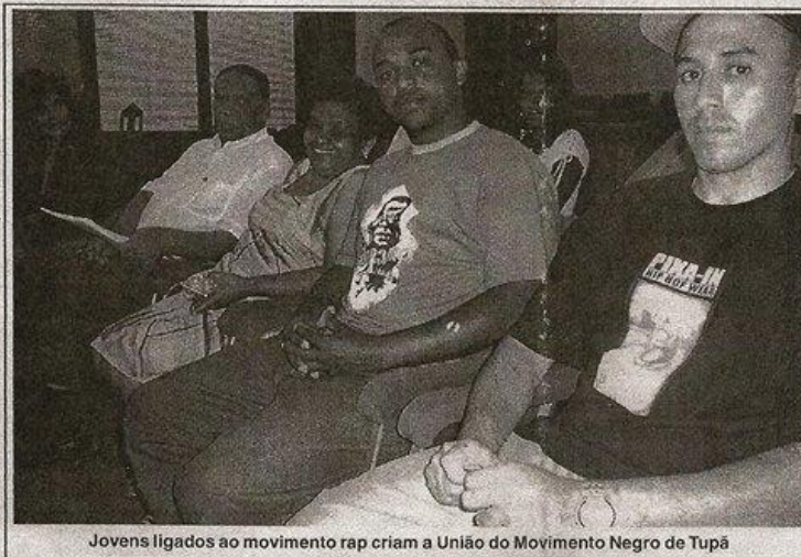
Jovens ligados ao movimento rap criam a União do Movimento Negro de Tupã

Além de oficializar a Umont, o grupo firmou parceria com organização não governamental Artevidas - Reacendendo Vidas Através da Arte -, que mantém trabalho social e cultural com crianças e adolescentes dos jardins Marabá e Unesp I e II. As atividades são desenvolvidas na sede da ONG, que fica no prédio