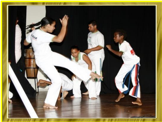
Roda de Capoeira