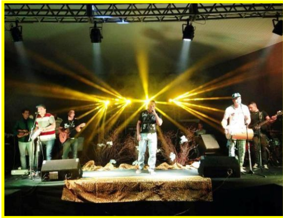
Grupo de Samba e Pagode